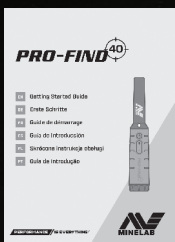
多言語対応 使用方法